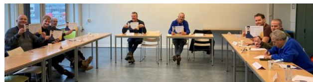
2 februari 2023: Mammoet, Van der Meij/Kuuk, Van Alphen, BAM