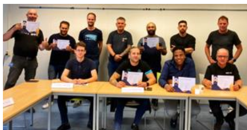
8 september 2022: Bilfinger, Delta Team, GWOC, Hoco RST, VolkerRail

De firmamedewerkers die in de jaren 2019-2020-2022-2023 de trainingen hebben gevolgd zullen een geplastificeerde pas op naam ontvangen waaruit blijkt dat ze Toezichthouder zijn. Ook voor Toezichthouders van Tata de zogn. Coördinator Omgeving (voorheen Coördinerend Toezichthouder) geldt dat ze dit kunnen aantonen (niet via een pas maar in het PeopleLink systeem van Tata).