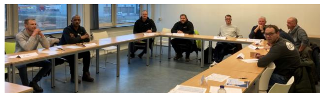
24 januari 2023: CA de Groot, TES, Danieli-Corus, OBH, BAM, Van Alphen